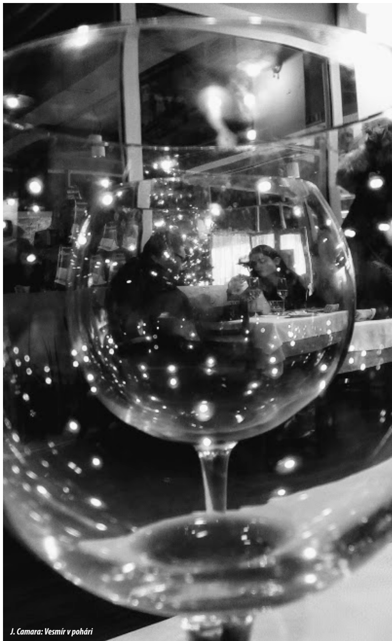
J. Camara: Vesmír v pohári

Časopis Dialóg vychádza s podporou Cirkvi bratskej, ale obsah jednotlivých príspevkov nevyhnutne nevyjadruje duchovné presvedčenia Cirkvi bratskej.