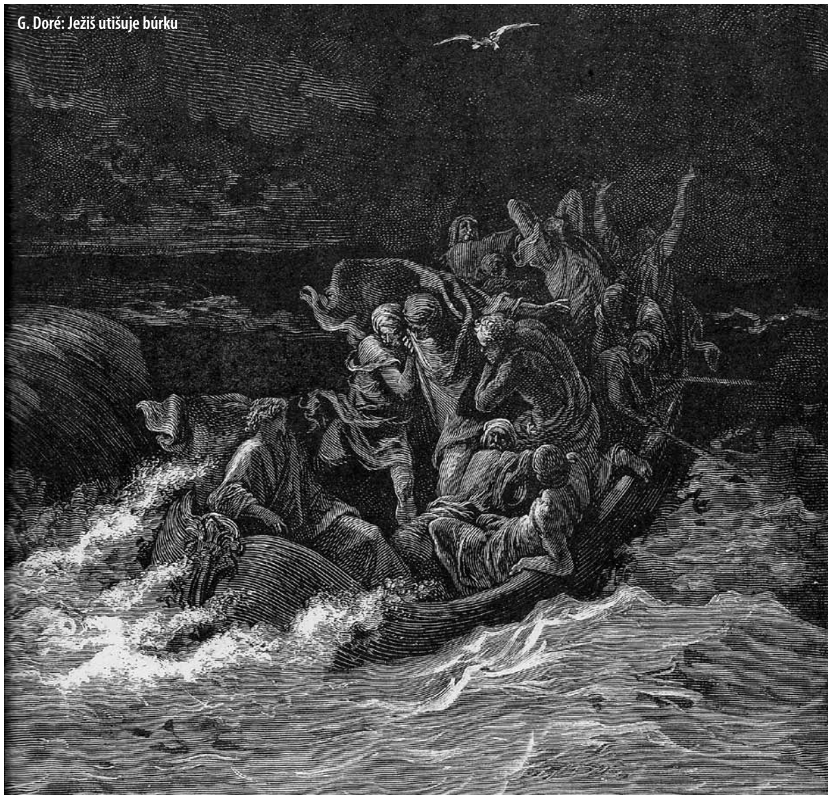
G. Doré: Ježíš utiňuje búрку

kov je možné pripomenúť, že oni ešte nevedeli, že ich Učiteľ sa pripravuje za nich položiť svoj život. Po napomenutí učeníkov za ich vystrašenosť, nenabrali smelosť a sebadôveru, ako by sme čakali, ale zmocnil sa ich nový, veľký strach. Za tento druhý strach si však už nevyslúžili napomenutie. Nie je to zvláštne?