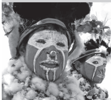
Ženy s pomalovanými tvármi sa zúčastňujú kultúrneho festivalu v Goroke v Papue Novej Guinei