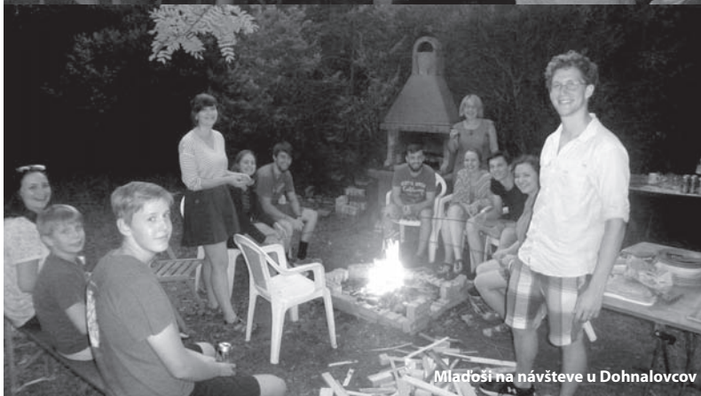
Mladoši na návšteve u Dohnalovcov