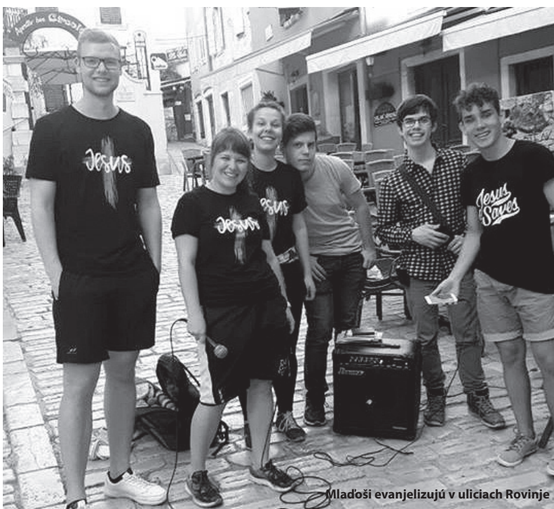
Mladoši evanjelizujú v uliciach Rovinje