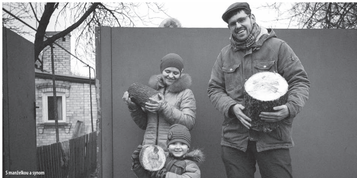
S manželkou a synom