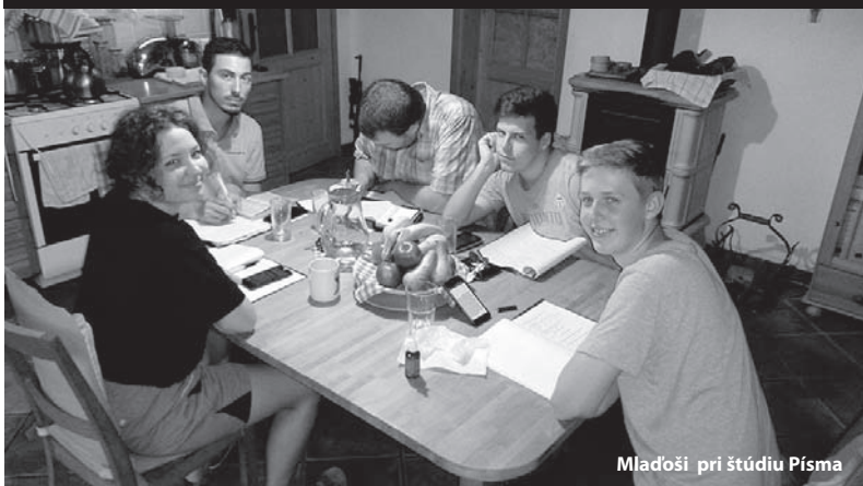
Mladoši pri štúdiu Písma