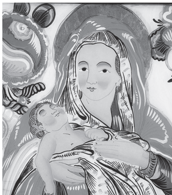
Sklomalba, Salzmannovský okruh: Madona s dieťaťom, 19. stor.