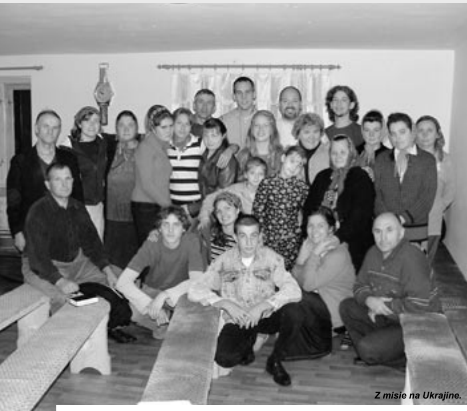
Z misie na Ukrajine.

V DIALÓGU 4/2008 sme sa venovali domácej misii, misii na Slovensku s akcentom na zakladanie nových zborov. V tomto čísle sa trochu pozrieme za hranice našej vlasti, na misijné pôsobenie niektorých členov cirkvi bratskej v zahraničí.