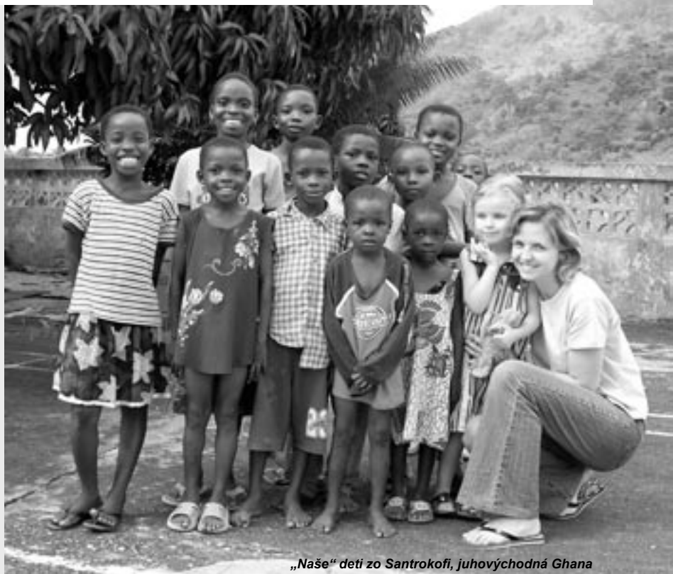
„Naše“ deti zo Santrokofi, juhovýchodná Ghana