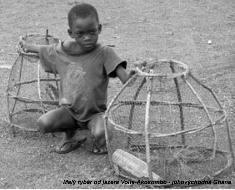
Malý rybár od jazera Volta-Akosombo - juhovýchodná Ghana