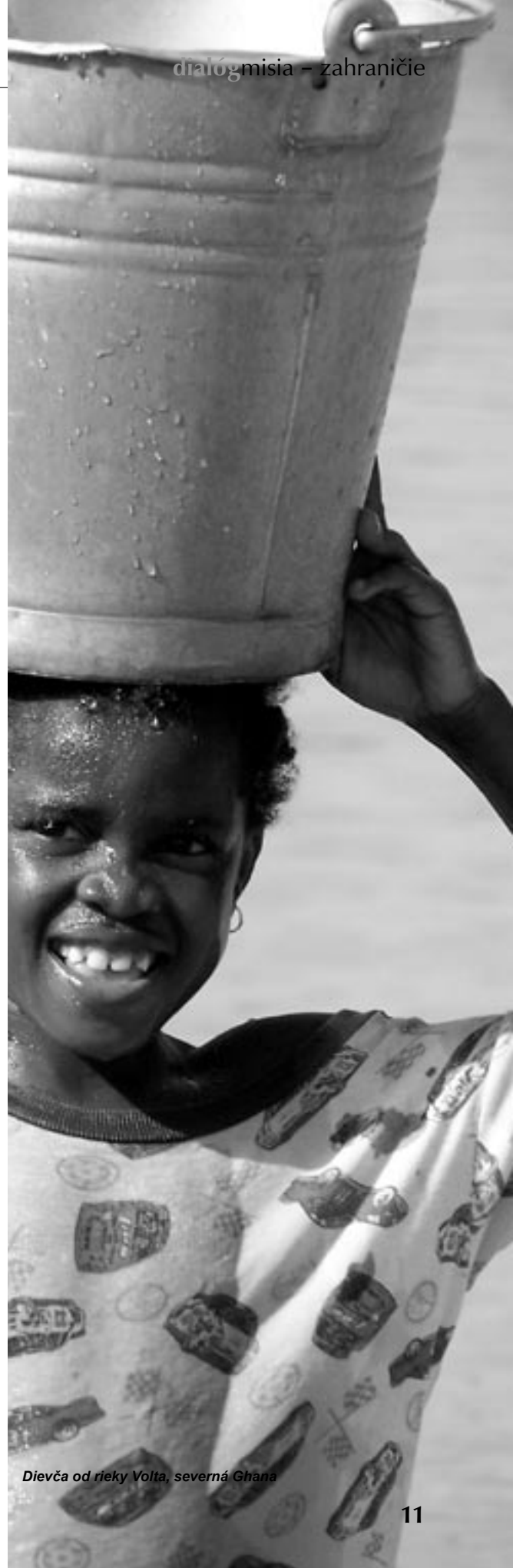
Dievča od rieky Volta, severná Ghana