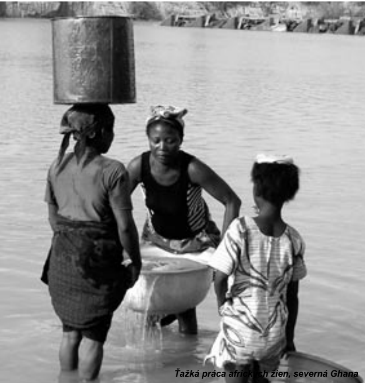
Ťažká práca afrických žien, severná Ghana