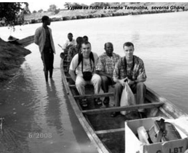
Výjazd za ľuďmi z kmeňa Tampulma, severná Ghana