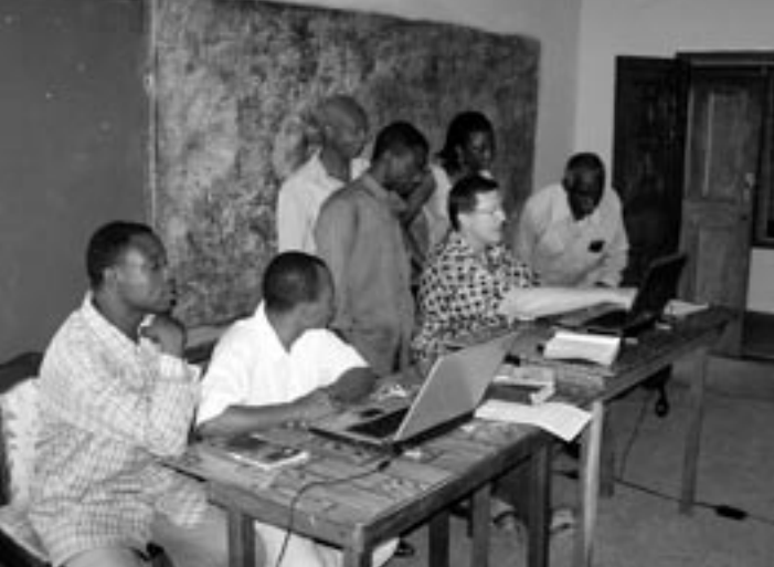
Tímy prekladateľov Biblie do jazykov Sele, Sekpele, Siwu a Tuwuli, - juhovýchodná Ghana

evanjelia v 4 jazykoch, tréning domorodých pracovníkov vo využívaní rôznych softvérov... to sú len niektoré z výziev, ktoré predo mňa práca v misii postavila.