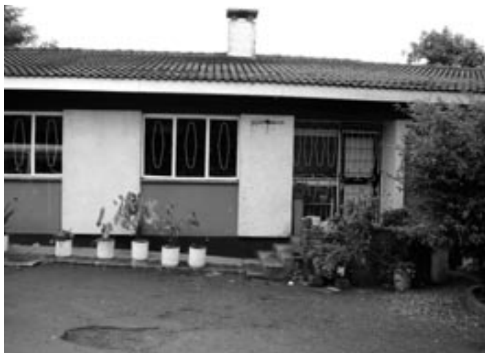
Children's Garden, budova detského domova