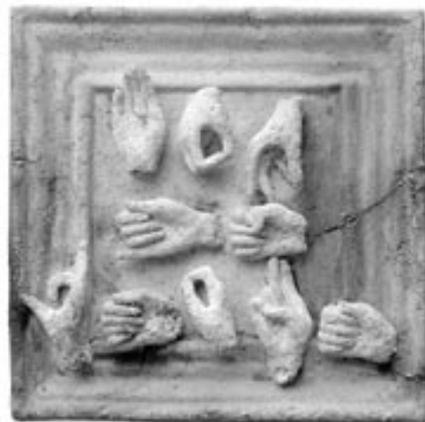
JAROSLAVA ŠICKOVÁ-FABRICA: Ruky II, šamot, 2007