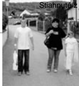
Na výlete v Rakúsku